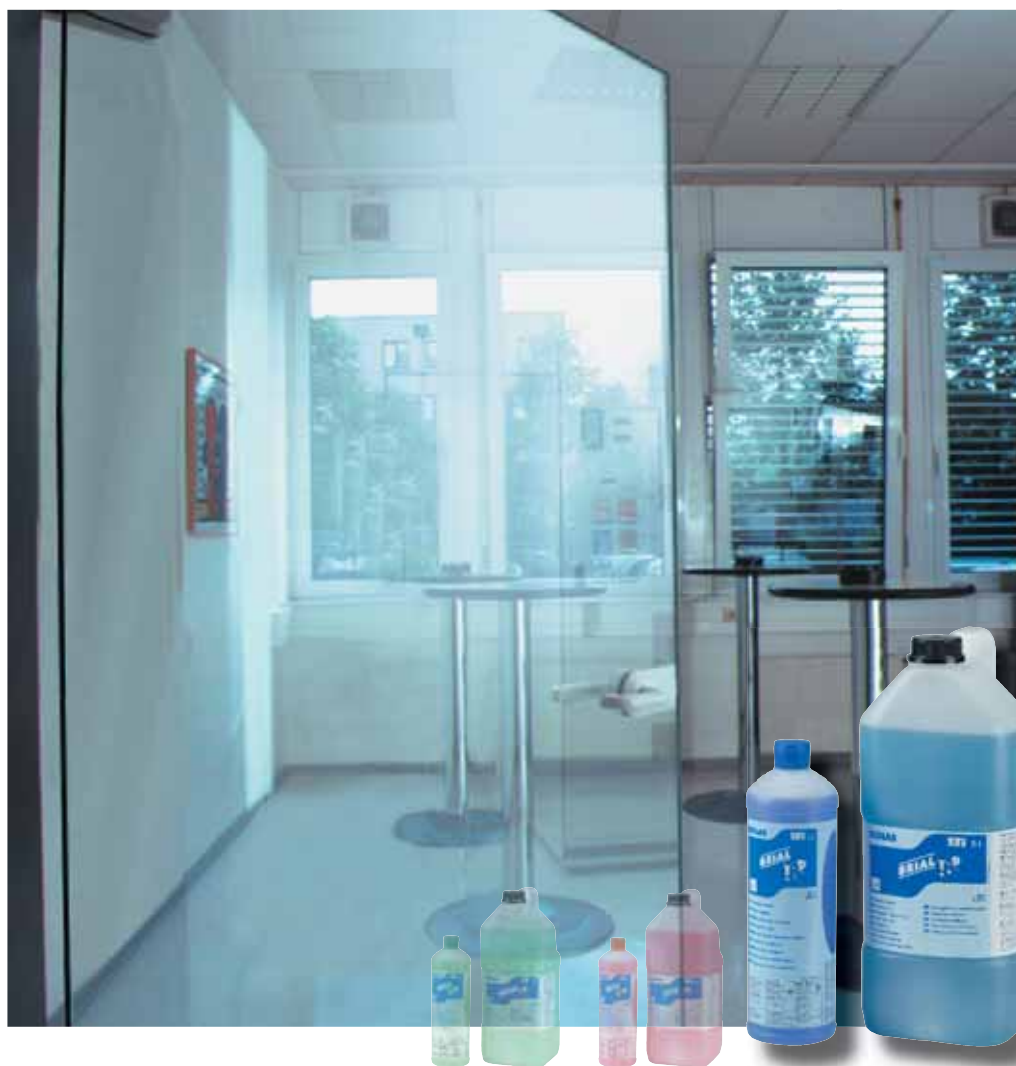
Un produit de la gamme TOP

Détergent ménageant pour l'usage quotidien